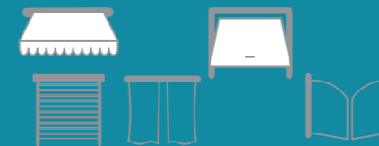
SOMFY MOTORISERTE PRODUKTER

Kompatibelt utstyr avhenger av din konfigurasjon