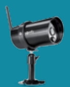
UTENDØRS KAMERA VISIDOM OC100

Somfy har laget flere pakketilbud for belysning og sikkerhet. Snakk med din forhandler om aktuelle tilbud og kom i gang med å bygge opp et smart hjem.