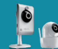
INNENDØRS KAMERAER VISIDOM ICT100 eller VISIDOM ICM100